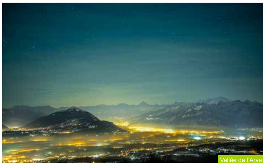
Vallée de l'Arve

PROJECTIONS DU PROJET D'AGGLOMÉRATION 2007-2030 + 200 000 habitants (50% France et district de Nyon, 50% canton de Genève) + 100 000 emplois (30% France) + 50 000 logements d'ici 10 ans