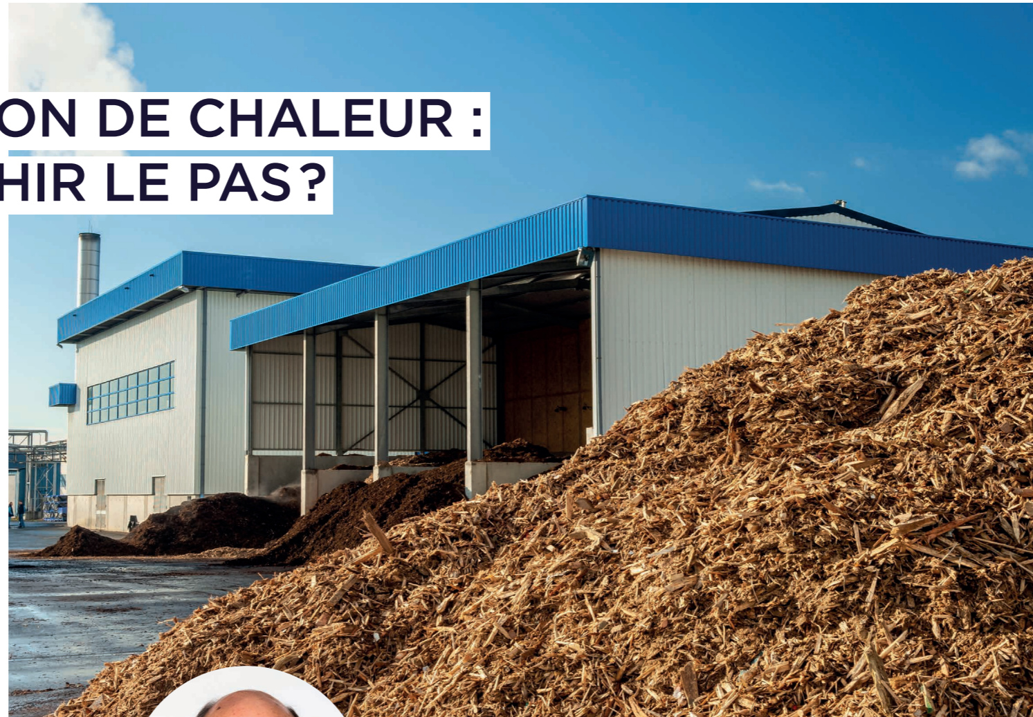
Exemple d'une chaufferie bois, équipement éligible au dispositif.

Depuis deux ans, les menaces sur l'approvisionnement se sont accentuées avec pour conséquence une augmentation du coût de l'énergie. Afin d'avancer vers notre indépendance énergétique tout en sortant des énergies fossiles, le recours aux énergies renouvelables est une solution clé, d'autant qu'elle est génératrice d'emplois locaux, non délocalisables.