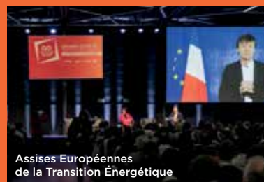
Assises Européennes de la Transition Énergétique

Faire le choix du Genevois français, c'est opter pour une destination attractive, idéalement placée au cœur de l'Europe, en pleine dynamique ; c'est nourrir l'espoir de jouir d'une vie plus intense pour son entreprise, ses projets, sa famille. Choisir le Genevois français, c'est décider d'activer son avenir en s'appuyant sur une valeur sûre des territoires à haut potentiel.