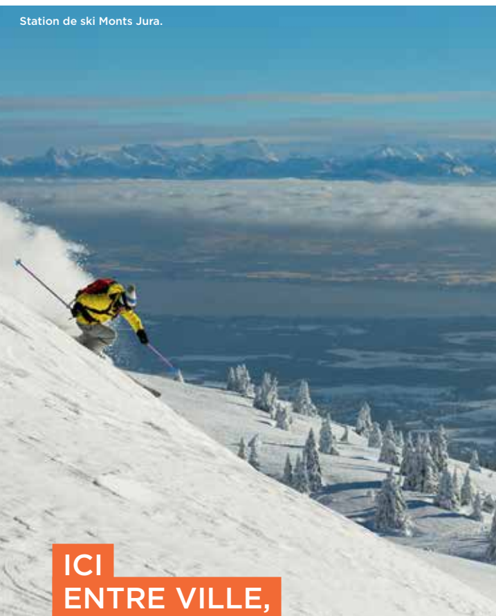
Station de ski Monts Jura.