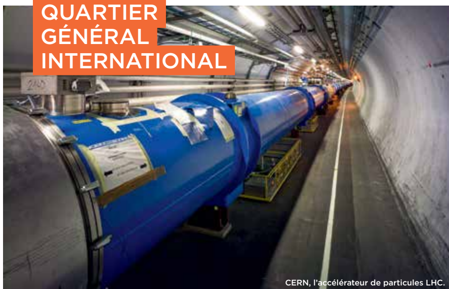
CERN, l'accélérateur de particules LHC.

L'organisation européenne pour la recherche nucléaire (CERN), le quartier des organisations internationales dont l'ONU et l'OMC (premier centre de gouvernance mondial), de grands comptes internationaux, un tissu riche de PME et ETI fortes à l'international confèrent au territoire une dimension cosmopolite, sans nul autre pareil. Ici, vous côtoyez 190 nationalités aux cultures extrêmement diverses et pouvez rejoindre tout point de la planète aisément grâce à l'aéroport international de Genève. Le Genevois français? L'esprit ouvert!