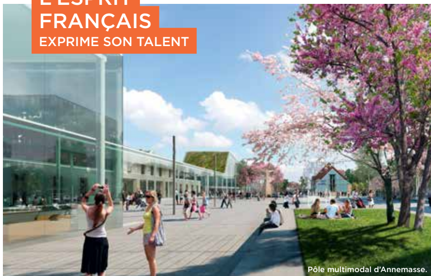
Pôle multimodal d'Annemasse.

Propulsé par la dynamique genevoise, le Genevois français a su tirer parti de cet essor pour exprimer toute sa singularité. Cette « touche française », on la retrouve aussi dans l'art de vivre, dans l'esprit d'entreprise et dans la soif de culture et de divertissement. Et aujourd'hui ce sont les grands projets comme Etoile Annemasse-Genève, Ferney-Genève Innovation, l'Ecoparc du Genevois, ou bien encore les pôles gares de Thonon-les-Bains ou de Saint-Julien-en-Genevois, qui dessinent de nouvelles polarités de la métropole genevoise. Un développement accompagné par la stratégie d'enseignement supérieur menée par le Genevois français, valorisée autour de la marque « Grand Forma », qui relie 7 pôles complémentaires de formation du territoire autour de domaines d'excellence créateurs d'emplois et de valeur ajoutée.