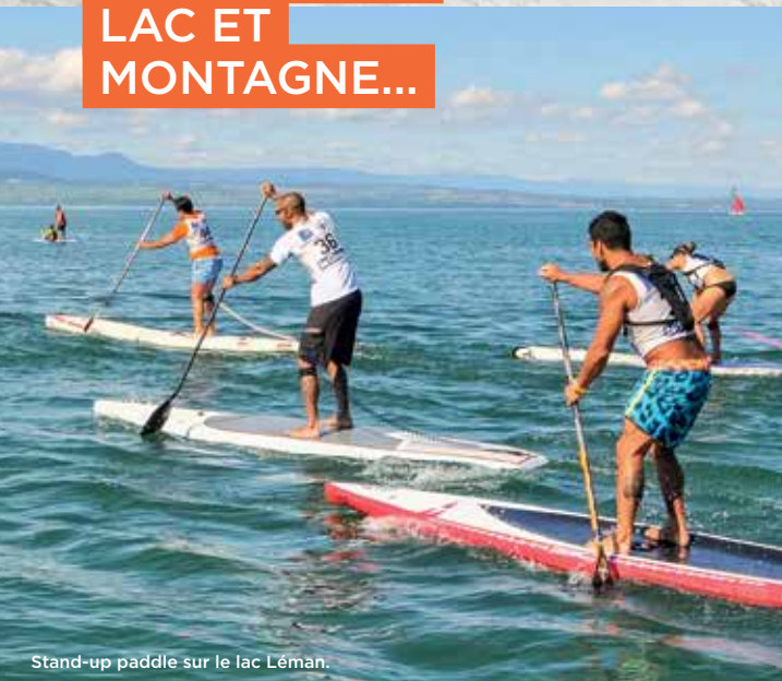
Stand-up paddle sur le lac Léman.

Avec 87% du territoire en espaces naturels et agricoles, le Genevois français c'est la promesse d'une immersion dans les grands espaces , du Mont-Blanc et des Alpes franco-suisse aux montagnes du Jura. C'est la possibilité de pratiquer ses sports outdoor préférés, sur l'eau, dans les airs ou sur les pentes! À moins d'une heure du Genevois français, les stations de montagnes des Portes du soleil et des montagnes du Jura vous attendent : ski, raquette, rafting, randonnée, VTT, parapente. C'est aussi une invitation à faire des escapades shopping et bien-être, gourmandes et culturelles, de Divonne-les-Bains à Thonon-les-Bains en passant par Yvoire, Saint-Julien-en-Genevois ou bien encore Genève. Le Genevois français, vous n'en reviendrez pas!